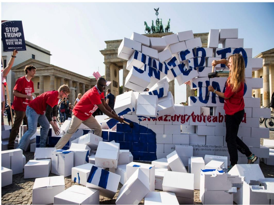
反对者在推倒“川普墙”

美国是一个移民国家，总统特朗普自己也是移民的后代，他为何执意对移民开刀呢？因为，这符合他“美国优先”，“美国人优先”的理念。而之所以能够掌握如此众多无证移民的信息，是与美国的救济方式有关联的。比如，向贫困者发放领取饮食餐票的“食物站点”，就是一个获得无证移民信息的来源地。美国政府就是通过类似的渠道，