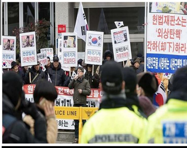
朴槿惠反对者与支持者在首尔分别游行