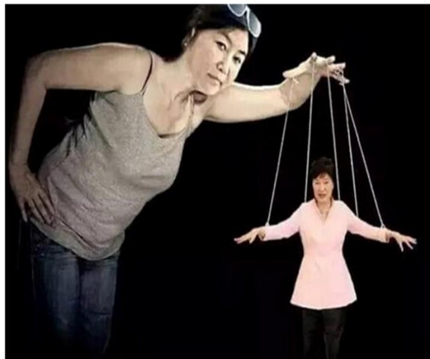
闺蜜门中的朴槿惠如同一只提线木偶