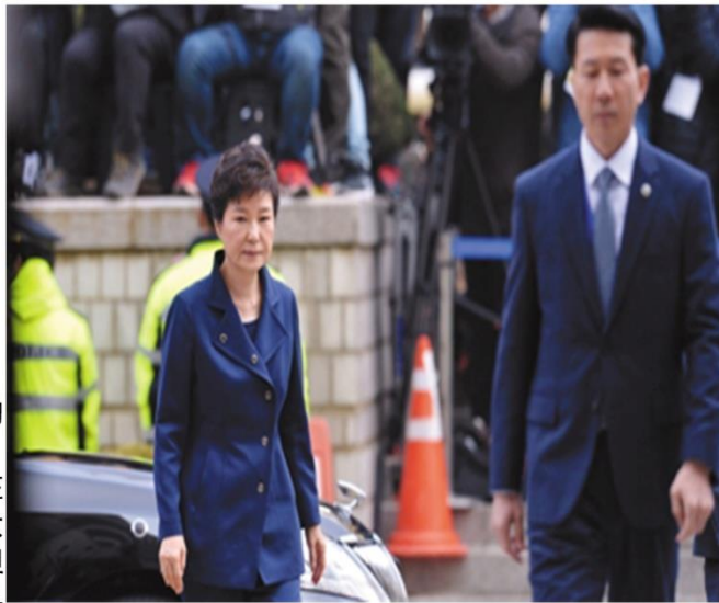
3月30日，韩国首尔中央地方法院，韩国前总统朴槿惠出庭受审

“慰安妇”是指日本军国主义在二战期间对朝鲜和其他亚洲受害国人。朴槿惠上台，对于“慰安妇”有着特别的关注，对日本也采取着特别强硬的态度，受到韩国人民的支持。但是在日方对慰安妇罪行公开致歉，并仅仅拨款10亿日元（830万美元）协助韩国成立支援慰安妇的基金会后，朴槿惠便了结了“慰安妇”事件，并撤销了韩国教育部2014年修订的小学六年级教科书中增添了有关“战场日军慰安妇”为主题的内容和照片。这是纯正的就被日本的10亿日元给收买了，做出了卖国的行为。很显然朴槿惠的这种会让韩国人民厌恶，但她最开始的初衷是好的，但是由于一些原因导致她外交的失败，并疑是有卖国的行为，这样